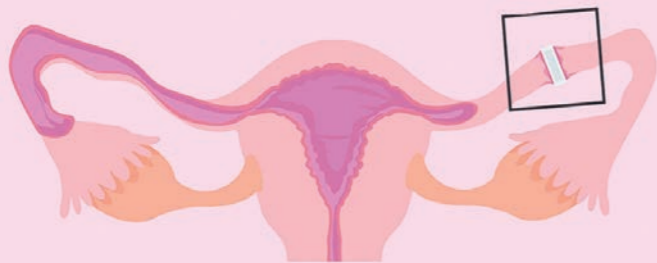
Ligadura de trompas por oclusión tubárica