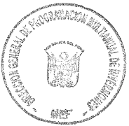
MARÍA ANTONIETA ALVA LUPERDI Ministra de Economía y Finanzas