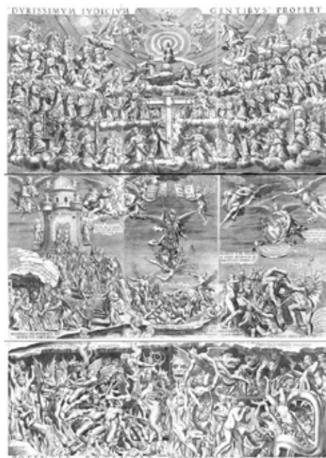
Phillipe Thomassin. Juicio Final , 1606. Grabado, Roma

Esos conjuntos -infortunadamente mermados por un incendio reciente- compendian la original madurez de Quispe Tito. Su manera personal irá dando cuenta de una esforzada y constante evolución, que lo llevaría a recrear con gran habilidad las fórmulas del barroco flamenco. Especialmente dotado para la composición, logró alternar e incluso combinar modelos gráficos de épocas y estilos distintos, desde el romanismo contrarreformista hasta el barroco triunfal de la escuela de Rubens. A través de una pincelada precisa y ágil, al servicio de una vivaz sensualidad cromática,