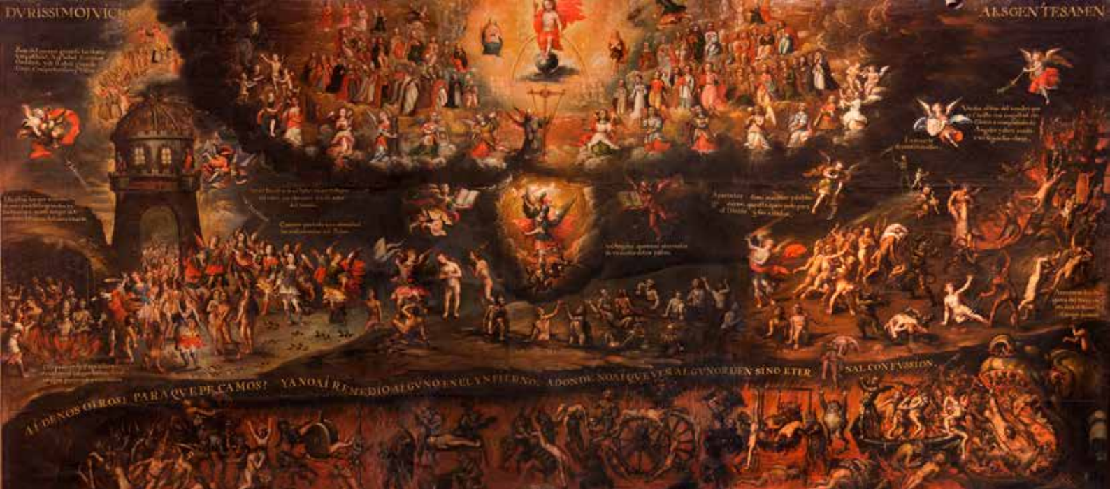
Diego Quispe Tito. Juicio Final , 1675. Óleo sobre tela, 5,82 x 2,80 m., Cuzco, Convento de San Francisco.

tercer concilio limense- que cada templo del virreinato debía tener en lugar visible este relato escatológico «para que sea testigo del cristiano pecador». Como es evidente, la prefiguración de ese momento, crucial para el destino humano, ponía en escena la lucha entre el bien y el mal, así como la oposición premio-castigo: una dialéctica persuasiva que demostró gran eficacia no solo en el contexto de la evangelización y las «extirpaciones de idolatrías», sino que lograría extender su mensaje admonitorio a lo largo de toda la historia virreinal.