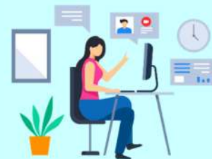
REGIÓN ANCASH: TRABAJADORES EN EL SECTOR FORMAL PRIVADO POR SITUACIÓN ESPECIAL DE TRABAJO, MAYO 2020 (Porcentaje)

Elaboración: DRTYPE-Observatorio Socio Económico Laboral (OSEL) Áncash