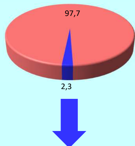
REGIÓN ÁNCASH: TRABAJADORES DEL SECTOR FORMAL PRIVADO EN SITUACIÓN DE TELETRABAJO SEGÚN CONDICIÓN MIXTO O COMPLETO, MAYO 2020 (Porcentaje)