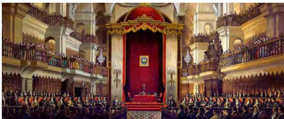
Anónimo. Primer Congreso Constituyente, 1822. Óleo, Lima

Sin embargo, fue en el extenso estudio «José Faustino Sánchez Carrión, tribuno de la República» en donde Porras desarrolló, con la convicción que deriva de la madurez intelectual, el enlace entre liberalismo, republicanism, civilidad y democracia. No fue casual que el mismo tuviese su origen en un discurso pronunciado en el Centro de Estudios Histórico Militares en 1953. Porras, en su deseo de reconciliar lo civil y lo militar, señaló al iniciar dicha alocución que «en ninguna época fue más fecunda la alianza de la pluma y de la espada que en el tiempo heroico de la emancipación». Otro aspecto que le preocupó dejar esclarecido desde un principio fue su distanciamiento con lo que denominó metodología histórica conservadora de la emancipación, que no solo omitió «la impronta de libertad de la época, [sino que] pagó tributo a la concepción aristocrática o individualista de la historia y al culto cesarista de los caudillos». Con este reclamo hizo pública la necesidad