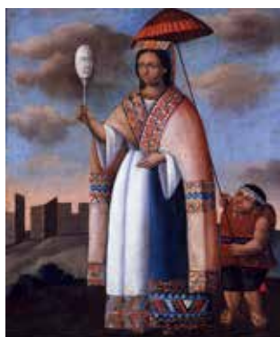
Mama Ocllo, ca. 1840, San Antonio Museum of Art