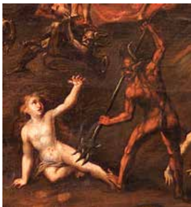
Diego Quispe Tito. Juicio final (detalle). 1675. Cuzco, Convento de San Francisco

Al respecto, resulta curioso que la carta del virrey precise la rareza del suceso tratándose de una ciudad del Perú que, de acuerdo con la opinión general, estaba preservado de energúmenos por intercesión divina: «Da cuenta a Vuestra Majestad de que, habiendo preservado Dios los reinos del Perú de endemoniados, lo están hoy más de cincuenta personas en el convento de Santa Clara de la ciudad de Trujillo». La protección divina de estos reinos se sustentaba en las ideas de Antonio León Pinelo, quien, en su erudita obra El paraíso en el Nuevo Mundo , analiza favorablemente las opiniones acerca de la existencia del paraíso y su localización en el círculo equinoccial o zona tórrida. La evaluación es admitida y amplía su justificación aludiendo a factores como el clima, la duración del día y de la noche o la fertilidad de la tierra. Así, el Perú es el paraíso recién encontrado, el jardín elegido por Dios para que nazca la primera santa del Nuevo Mundo, la «rosa de salutífera fragancia», cuyo olor a santidad preserva al reino entero. El Virreinato del Perú vive entonces un tiempo en que el florecimiento religioso y la inclinación hacia la santidad son llamativos, de ello dan fe los cinco santos de esa época: Toribio de Mogrovejo, Isabel Flores de Oliva o Rosa de Lima, Martín de Porres, Juan Macías, Francisco Solano; sin contar a los aspirantes a santos que, sumados, pasan la docena.