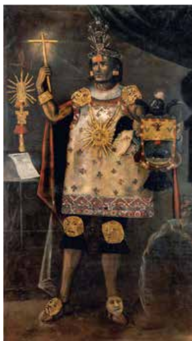
Alonso Chihau Topa, s. XVIII. Museo Inka, Cuzco