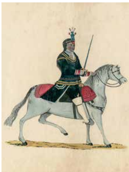
Anónimo. Túpac Amaro, siglo XVII. Río de la Plata