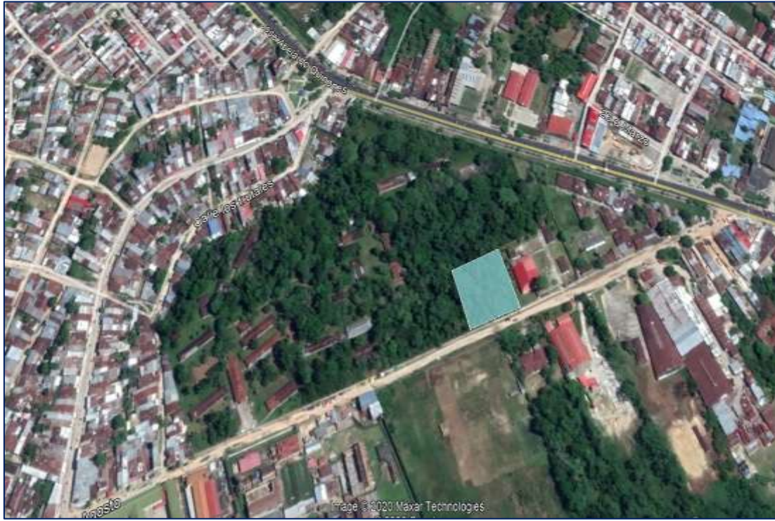
GRÁFICO 2. UBICACIÓN DEL CENTRO MACRORREGIONAL ORIENTE (IQUITOS)

Proyecto de inversión pública: Mejoramiento y Ampliación de los Servicios Brindados por el Sistema Nacional de Vigilancia en Salud Pública Versión Final, Abril 2021