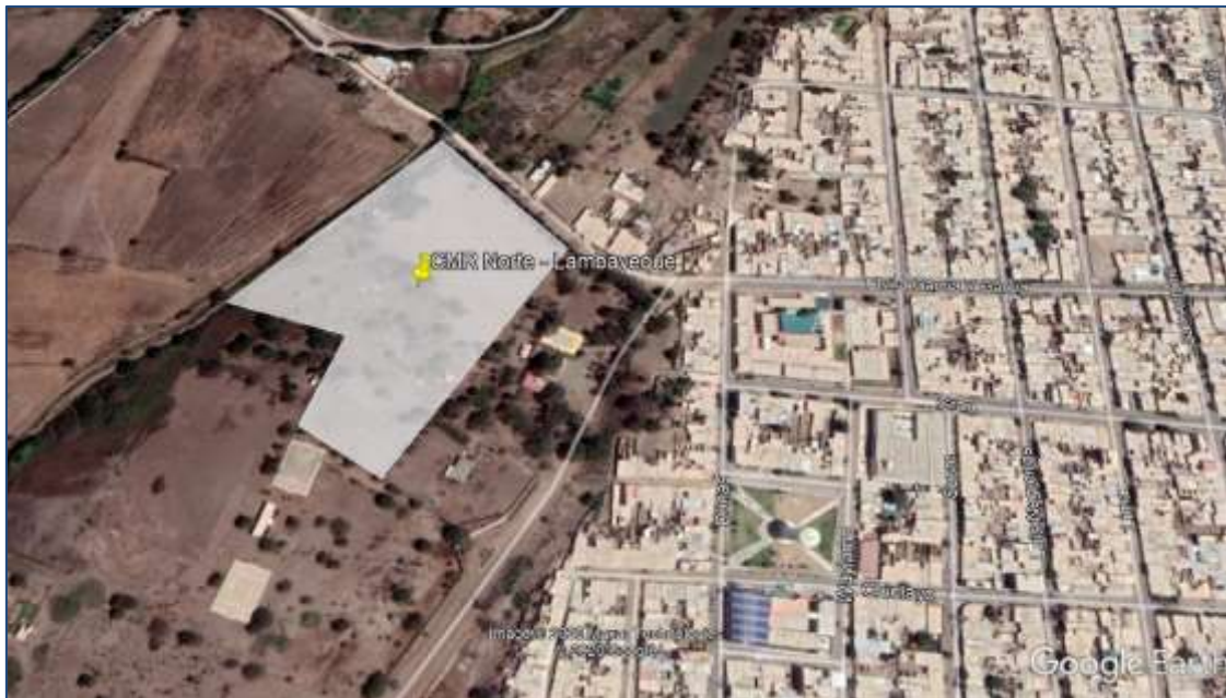
GRÁFICO 3. UBICACIÓN DEL CENTRO MACRORREGIONAL NORTE (LAMBAYEQUE)