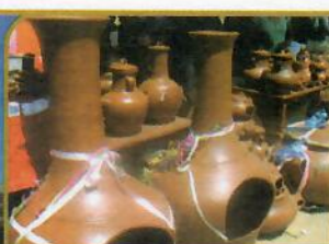
STO. DOMINGO DE LOS OLLEROS