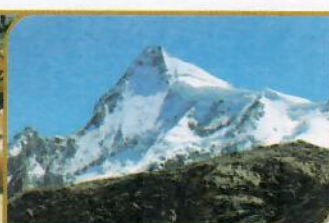
NEVADO DE PARIACACA