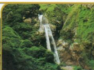
CATARATA DE ANTANKALLO