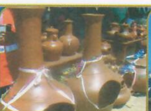
STO. DOMINGO DE LOS OLLEROS