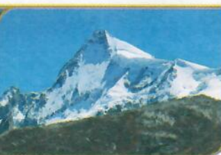
NEVADO DE PARIACACA