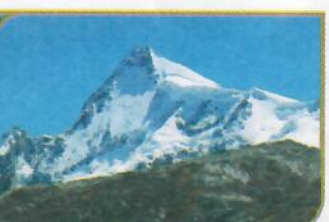
NEVADO DE PARIACACA