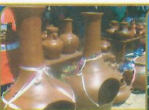
STO. DOMINGO DE LOS OLLEROS