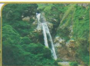
CATARATA DE ANTANKALLO