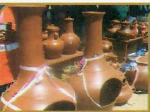
STO. DOMINGO DE LOS OLLEROS