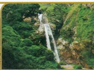
CATARATA DE ANTANKALLO