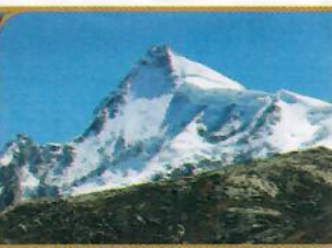
NEVADO DE PARIACACA