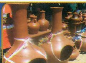
STO. DOMINGO DE LOS OLLEROS