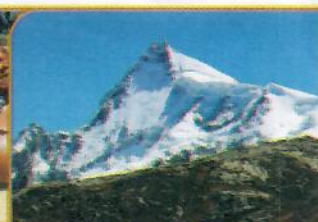
NEVADO DE PARIACACA