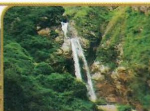
CATARATA DE ANTANKALLO