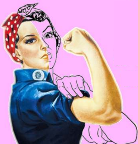
Población en Edad de Trabajar (PET) femenina (Porcentaje)