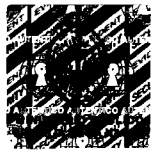
Zoraida Avalos Rivera Fiscal de la Nación

A handwritten signature in black ink, appearing to read "Zoraida Avalos Rivera".