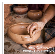
Elaboración de cerámica en Huancas