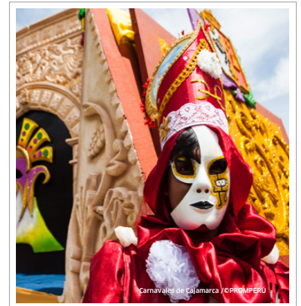
Carnavales de Cajamarca

Vuelos desde Lima a: • Cajamarca (1 hora) • Jaén (1 hora y 15 minutos)