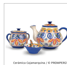
Cerámica Cajamarquina