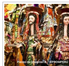
Piezas de Imaginería

1 444 artesanos registrados en el Directorio Nacional de Artesanos del MINCETUR.