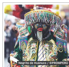
Negrito de Huánuco