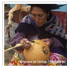
Artesana de Cochas

Esta región, ofrece en Hualhuas y en San Pedro de Cajas, tejidos de diferentes lanas y colores; en San Jerónimo de Tunán, finos trabajos de filigrana de plata; en Cochas, los famosos mates burilados, y en Mito y Molinos sus tallados en madera.