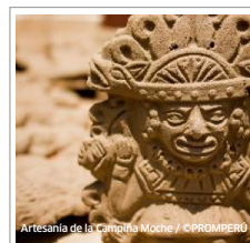
Artesanía de la Cangaña Moche