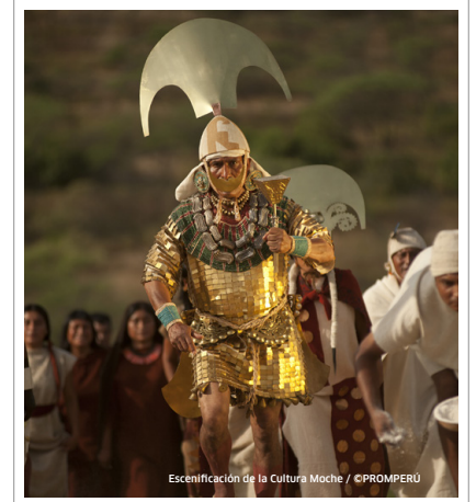
Espectáculo de la Cultura Moche