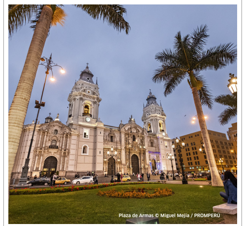
Plaza de Armas

• Vuelos regulares a las principales ciudades del mundo desde el Aeropuerto Internacional Jorge Chávez (ubicado en el Callao, a 30 minutos aprox. de la ciudad de Lima).