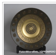
Plato decorativo

04 Asociaciones de Artesanos Hablando de la ciudad de Lima, destacó la orfebrería en plata, pues se hacían menajes de comedor con gruesas planchas. Hoy los trabajos son en láminas más delgadas y de plaqué, principalmente como platos recordatorios.