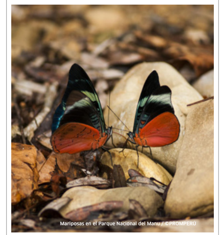
Mariposas en el Parque Nacional del Manu