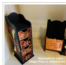
Repujado en cobre

07 Asociaciones de Artesanos, 40 Artesanos independientes y 01 Club de bisutería.