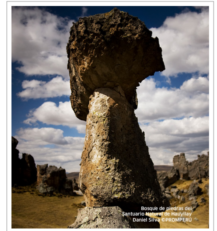
Bosque de piedras del Santuario Natural de Huayllay