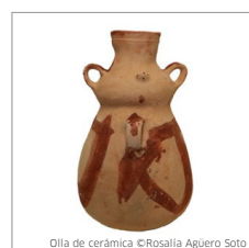
Olla de cerámica

02 Asociaciones de Artesanos Textiles, tallados en piedras, bisutería y fibras vegetales.