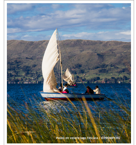
Paseo en velero lago Titicaca