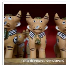
Torito de Pucará