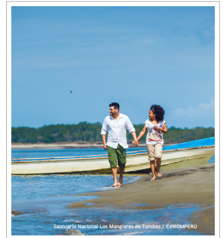
Santuario Nacional Los Manglares de Tumbes