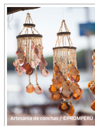
Artesanía de conchas