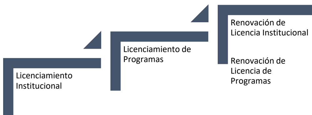
Gráfico N°1: Enfoque del Modelo de Licenciamiento