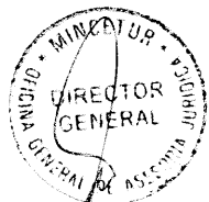
ROBERTO SÁNCHEZ PALOMINO Ministro de Comercio Exterior y Turismo