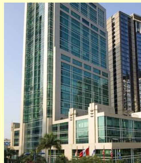
Embajada del Perú en Indonesia - Yakarta