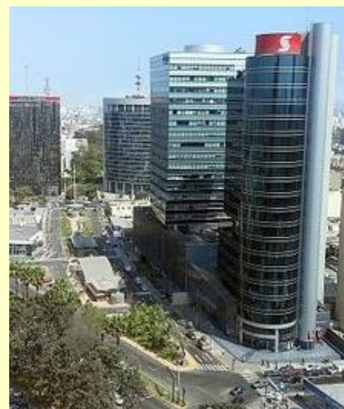
Centro Empresarial - Lima, Perú

La actividad de promoción concluyó con una rueda de preguntas y la degustación de las bebidas antes mencionadas, acompañadas de aperitivos y platos típicos de la gastronomía peruana: causa rellena, ají de gallina y ceviche.