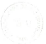
***** JUAN FRANCISCO SILVA VILLEGAS Ministro de Transportes y Comunicaciones.