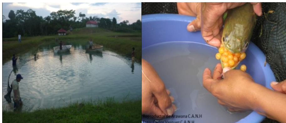
Imagen N° 02: Captura de Reproductores

Si en la extracción de la progenie se encontró huevos: