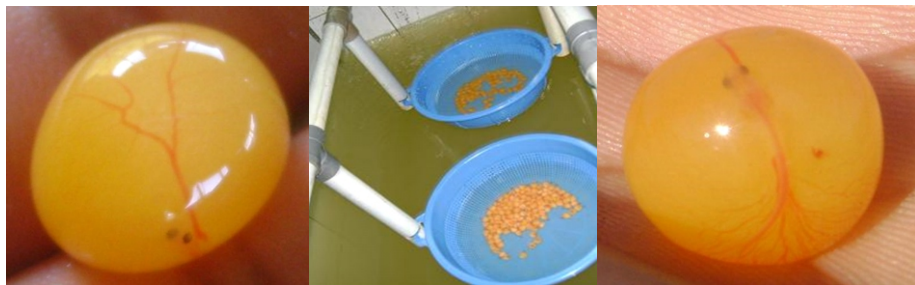
Imagen N° 03: incubación de huevos

Estos son trasladados al laboratorio de reproducción y acondicionados en las artesas horizontales, donde se han implementado incubadoras con cestos de plástico. Se debe suministrar un flujo de agua de 5 l/min, aquí es importante mantener la temperatura del agua en 29 °C. Este proceso de incubación oscila entre 05 a 07 días, lográndose una supervivencia superior al 30%. Las larvas recién eclosionadas presentan una longitud total de 1.5 cm.