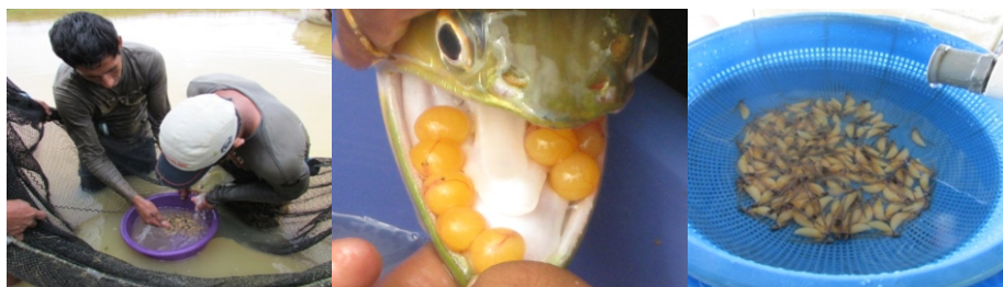
Imagen N° 04: Extracción de Progenie

A los 27 días después de la eclosión, las larvas pueden consumir alimento balanceado extruido al 45 - 50% de PB, simultáneamente con su saco vitelo. Ver el anexo del Flujograma de la reproducción de Arawana, la cual indica en detalle el proceso de reproducción de la Arawana hasta la obtención de alevinos.