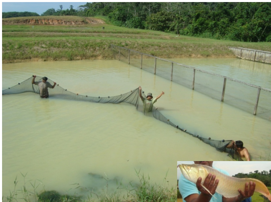
Imagen N° 01: Estanque de reproductores

La forma de los estanques deben ser rectangulares y de tamaños que pueden ir de 250 a 1000 m 2 , con un tirante de agua promedio de 1.5 metros.