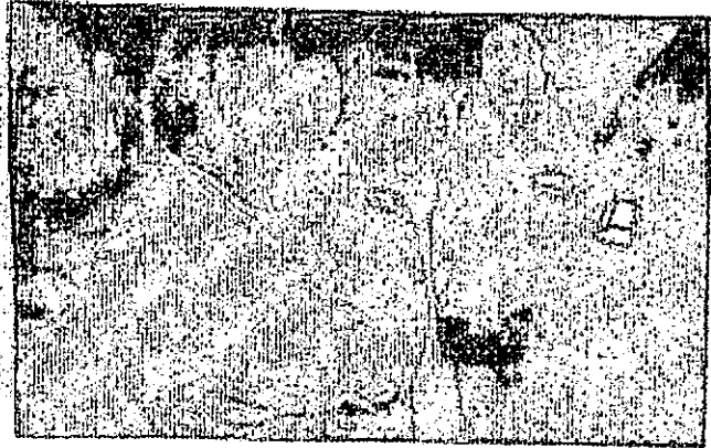
Una foto del tanista acusado de robar a una joven en estado de ebriedad.

Una foto del tanista acusado de robar a una joven en estado de ebriedad. Los efectivos de San José, al momento de estar en la zona, se encontraron con una persona que estaba en estado de ebriedad y se le encontró con un arma de fuego. Tras haber sido trasladado a la oficina de la zona, se le realizó un examen de sangre y se le encontró con un nivel de alcohol superior al permitido por la ley.