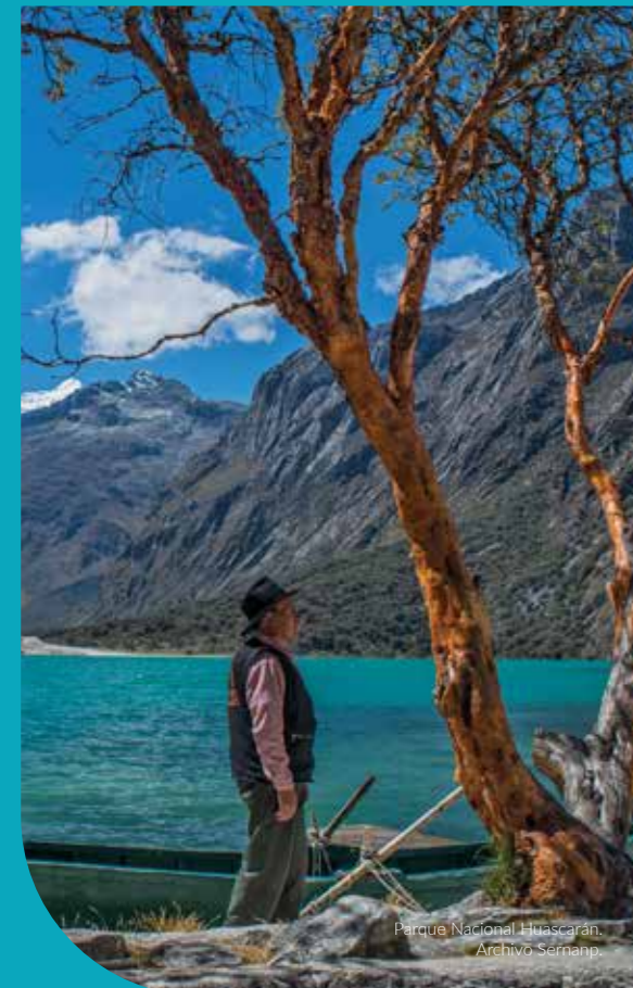
Parque Nacional Huascarán.

Dentro de las áreas naturales protegidas (ANP) de administración nacional. No siendo aplicables en sus zonas de amortiguamiento ni en las áreas de conservación regional.