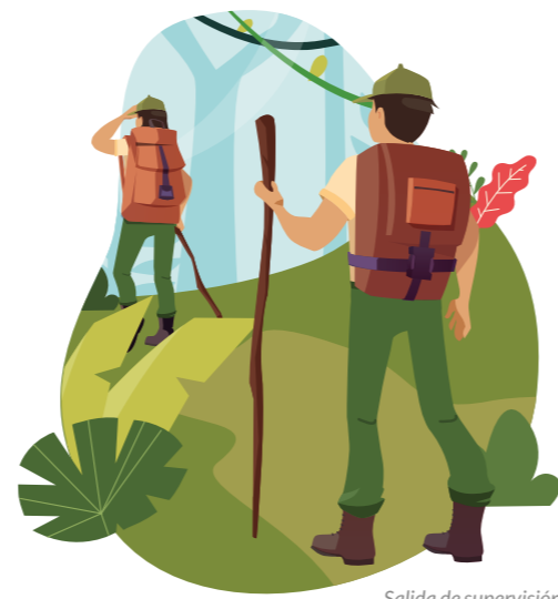
Salida de supervisión de recursos.

30 días hábiles de anticipación a la supervisión in situ