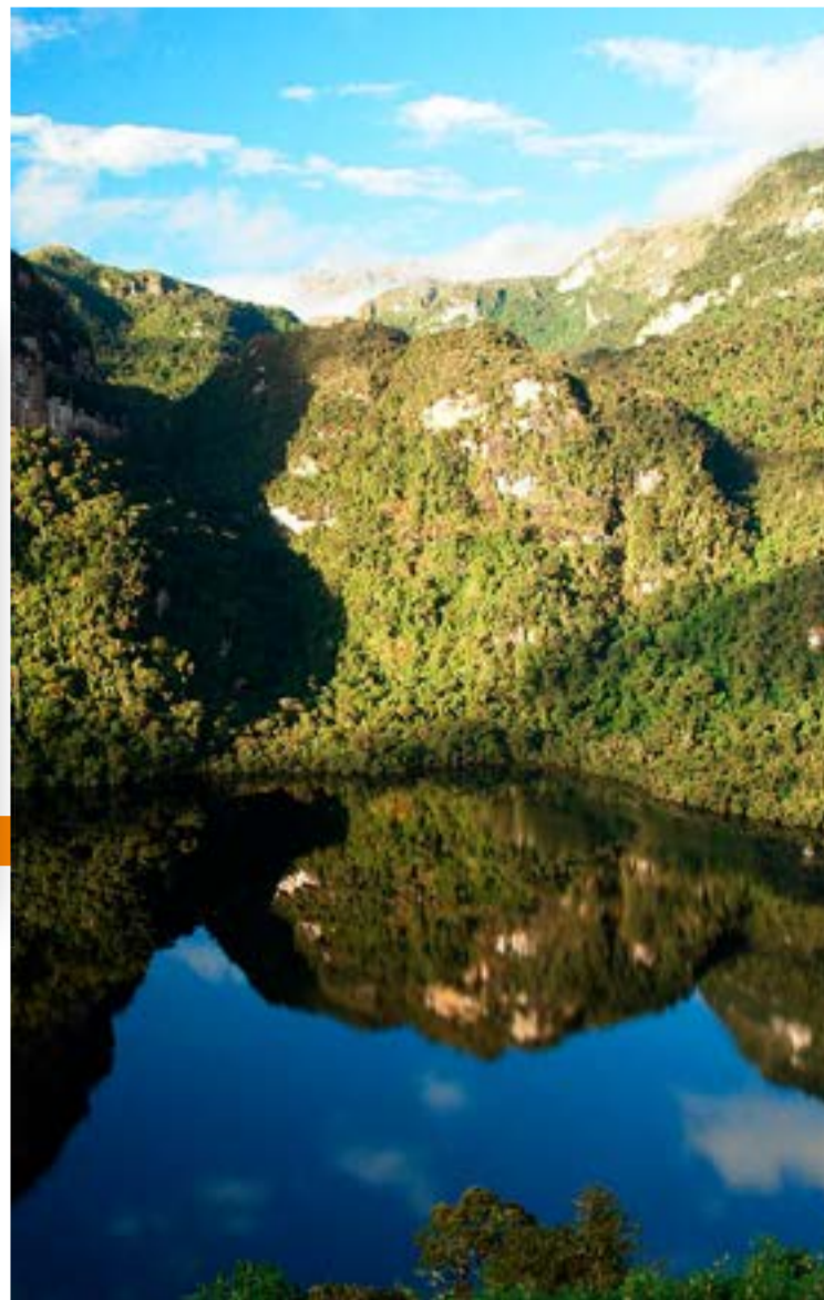
Laguna de los Cóndores - Amazonas

sierrayselvainforma@sierraexportadora.gob.pe