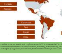
01 Taxonomías verdes existentes y en desarrollo

contribuyen así a orientar los flujos de capital hacia inversiones sostenibles y ayudan a aumentar la divulgación financiera de los actores del mercado público y privado, reduciendo las asimetrías de información y aumentando la transparencia financiera. En esencia, las taxonomías de finanzas verdes ayudan a los inversionistas, empresas, emisores y promotores de proyectos a navegar por la transición hacia una economía con bajas emisiones de carbono, resiliente y eficiente en el uso de recursos (EU, TEG, 2020).