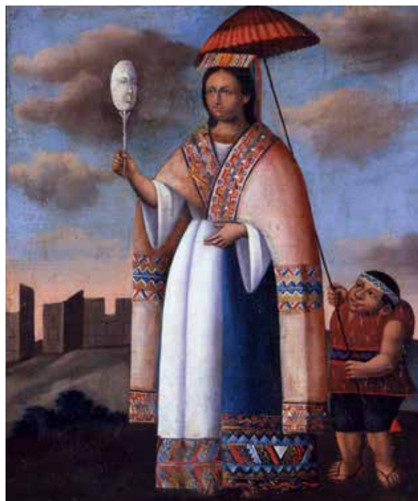
Anónimo. 1ª Coya , Cusco, s. XIX. Museo de San Antonio, Texas

El libro se completa con la transcripción de un conjunto de documentos clave para entender tanto la importancia de las encomiendas en general como la singular trayectoria de la ya mencionada Inés Muñoz. Debo destacar especialmente la lista que se nos ofrece con los nombres de las 137 mujeres que fueron beneficiarias de encomiendas, con la indicación específica de los repartimientos de indios de los que fueron titulares, al igual que del monto del tributo que recibían. Esta lista, sin duda, ayuda a ponderar la importancia social y económica que alcanzó ese grupo de mujeres. Además, son muy ilustrativos los mapas en los que se indican las encomiendas con beneficiarias femeninas a lo largo del siglo XVI. Ha sido paciente y rigurosa la labor de investigación de archivo en la que se fundamenta esta obra, a partir de la cual nos ofrece importante información antes no conocida sobre la encomienda en el Perú, y en particular sobre las mujeres que poseyeron tales mercedes. Además de los diversos repositorios españoles y peruanos consultados -incluyendo archivos regionales en el Perú-, debe destacarse la consulta de documentos del Archivo Histórico del propio Monasterio de la Concepción, cuyos fondos prácticamente no habían sido consultados previamente por historiadores.