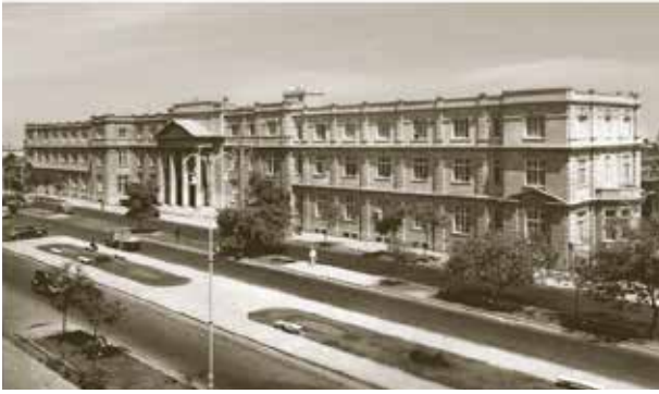
Hospital Arzobispo Loayza. Lima, 1924