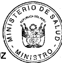
OSCAR RAUL UGARTE VILLUZ Ministro de Salud