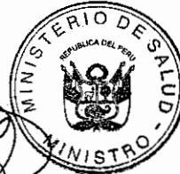
OSCAR RAUL UGARTE UBILUZ Ministro de Salud