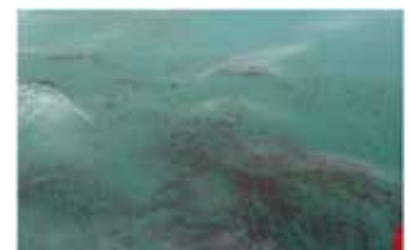
Toma de muestra de agua con presencia de petróleo disperso, punto ubicado al norte de la isla Ventanilla