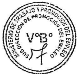
NIVEL DE CUMPLIMIENTO