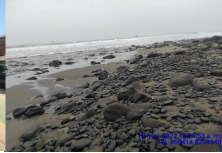
13 Mar 2022, 13:45:53 a. m. 41.350414 - 87.08540