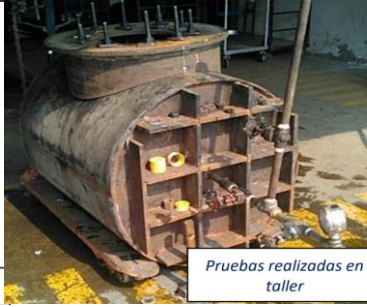
Pruebas realizadas en taller