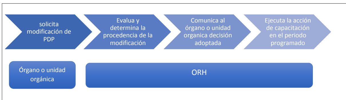
Gráfico: Pasos para la modificación del PDP por ORH

Si la acción de capacitación solicitada no cuenta con el sustento técnico no procederá la modificación del PDP, debiendo informar al órgano o unidad orgánica que lo requirió.