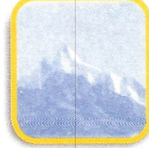
NEVADO DE PARIAKAKA