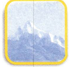
NEVADO DE PARIAKAKA