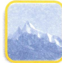
NEVADO DE PARIAKAKA