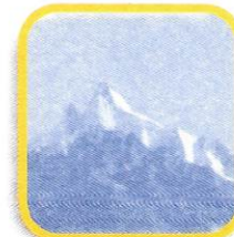
NEVADO DE PARIAKAKA