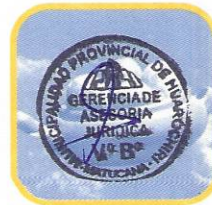
STO. DOMINGO DE LOS OLLEROS