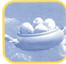
STO. DOMINGO DE LOS OLLEROS