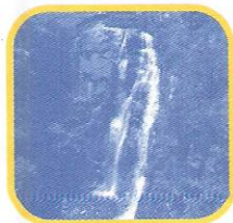
CATARATA DE ANTANKALLO