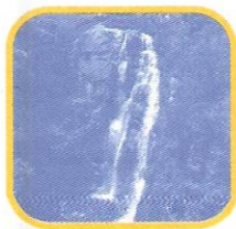
CATARATA DE ANTANKALLO