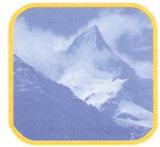
NEVADO DE PARIACACA