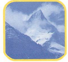
NEVADO DE PARIACACA