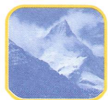
NEVADO DE PARIACACA