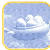
STO. DOMINGO DE LOS OLLEROS