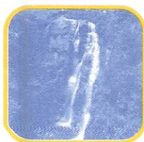
CATARATA DE ANTANKALLO