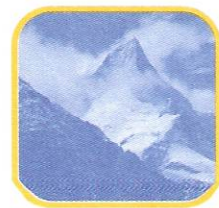
NEVADO DE PARIACACA