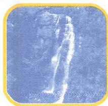
CATARATA DE ANTANKALLO