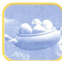
STO. DOMINGO DE LOS OLLEROS