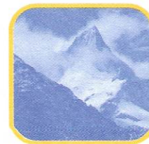
NEVADO DE PARIACACA