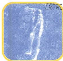
CATARATA DE ANTANKALLO