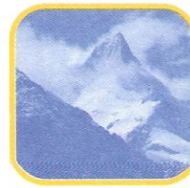
NEVADO DE PARIACACA