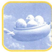
STO. DOMINGO DE LOS OLLEROS