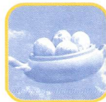
STO. DOMINGO DE LOS OLLEROS