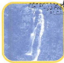
CATARATA DE ANTANKALLO