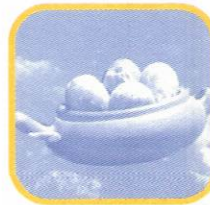
STO. DOMINGO DE LOS OLLEROS