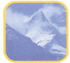
NEVADO DE PARIACACA