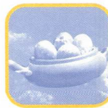
STO. DOMINGO DE LOS OLLEROS