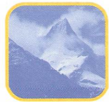
NEVADO DE PARIACACA