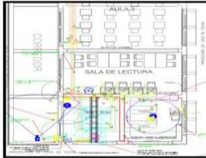
Figura 1 Vista en Planta General del Data Center

Se identifica la consideración del Data Center con su respectivo acondicionamiento y componentes principales del adicional de la especialidad de Data y Telecomunicaciones conforme al diseño y dimensionamiento respectivo y compatibilizados con la planilla de metrados, que cumpla con las condiciones mínimas de instalaciones y servicios conforme a la norma EM.020